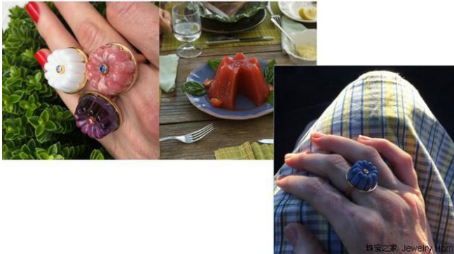
Cora Sheibani 果冻造型戒指，售价：£3,500-£42,00

Hemmerle 不仅推出一系列蔬菜珠宝，甚至出了本食谱！名为：《Delicious Jewels》为著名英国作家 Tamasin Day-Lewis 所著，精美的照片由 Simon Wheeler 所拍摄。书中包括整个 Delicious Jewels 系列作品，除此以外还有简单且精致的配料。