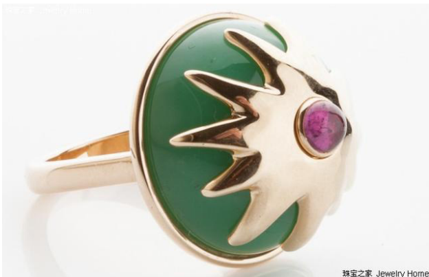
Cora Sheibani 布丁造型戒指，黄金，葡萄石 售价：£3,600 - £3,800

Cora Shaibani 是英国伦敦设计师品牌，Copper Mould 系列发布于 2011 年，以瑞士各式小甜点包括布丁、巧克力 Guglehopf（一种大理石花纹蛋糕）等为灵感，点缀以不同颜色的宝石，每一件单品都被赋予了可爱、和谐的色彩。