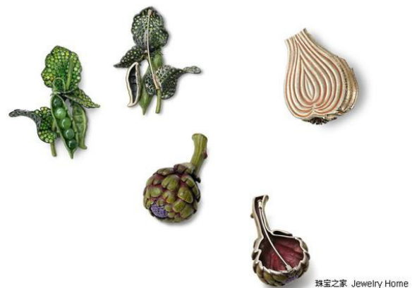
珠寶之家 Jewelry Home

Hemmerle Delicious Jewels 系列 洋葱胸针 (右上) 钻石，白金，银，铜、Hemmerle Delicious Jewels 系列 豌豆胸针白金，银，翡翠 (左上)、Hemmerle Delicious Jewels 系列 洋蓐胸针(下)白金，银，铜，蓝宝石