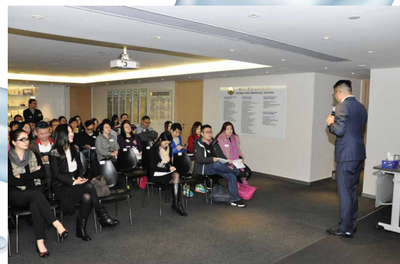
是次講座反應熱烈。