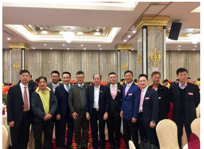
本會一行參加番禺珠寶文化節歡迎晚宴